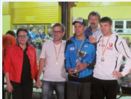
ULC Transfer St. Veit