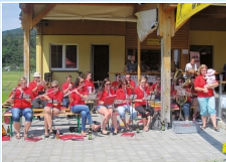
Blasorchester St. Veit