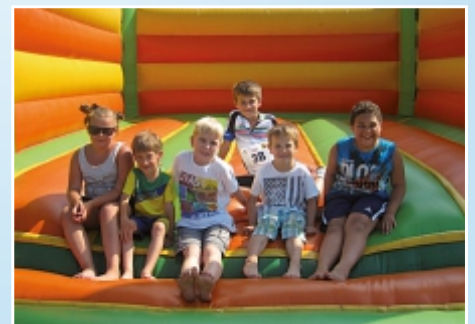
Hüpfburg - gesponsert von der Raiffeisenbank