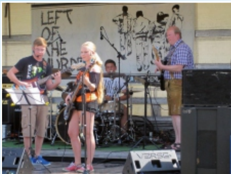
Band - Musikschule