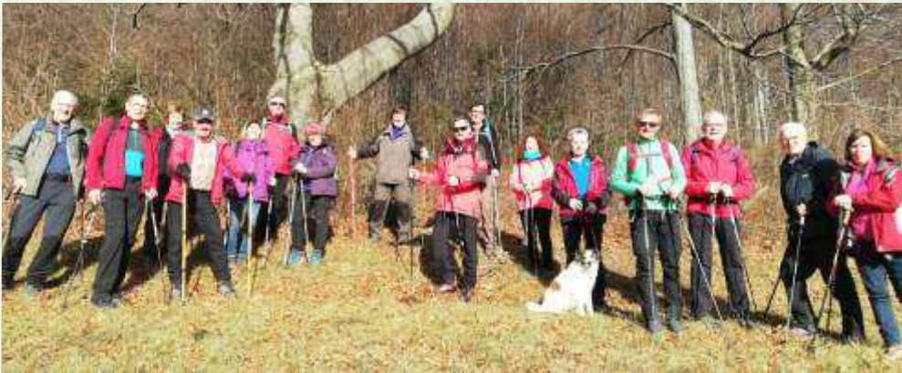
Strahlender Sonnenschein begleitete uns