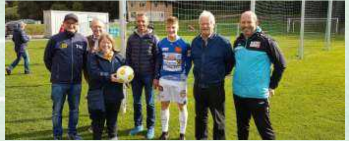
St.Veit – Schönfeld 05.10.19 Ergebnis 1:5