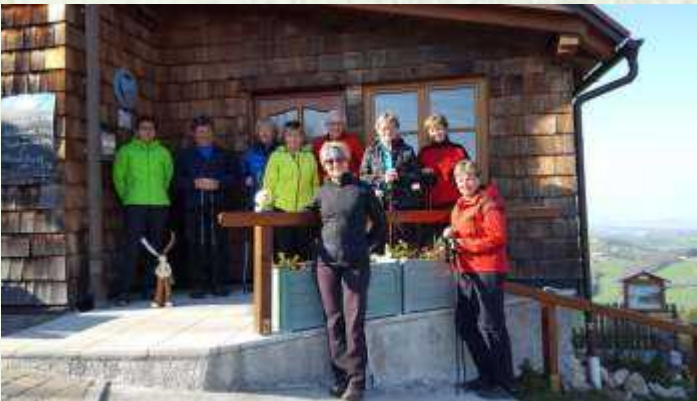
Kaiserkogel bei herrlichem Wetter