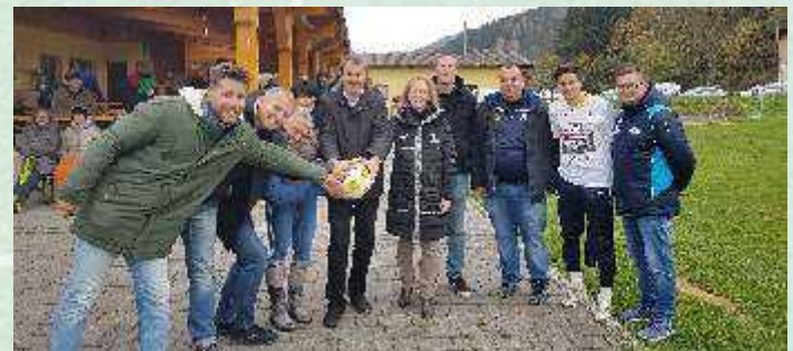
St.Veit – Karlstetten 02.11.19 Ergebnis 1:2