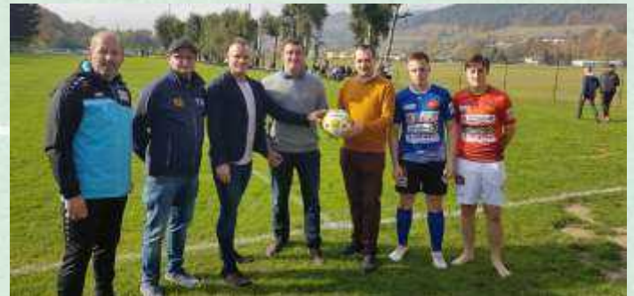
St.Veit – Pressbaum 19.10.19 Ergebnis 2:5