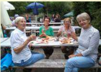
Einkehr bei Oberhellgrund