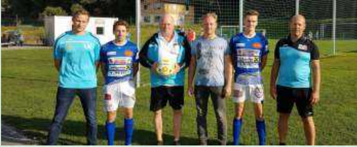
St.Veit – Mank 16.08.19 Ergebnis 1:1