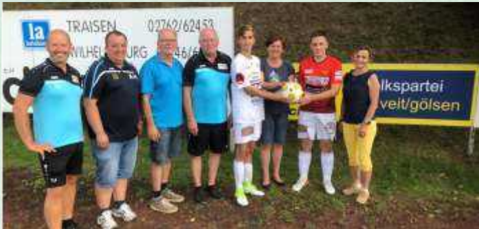
St.Veit - Obergrafendorf 31.08.19 Ergebnis 2:5