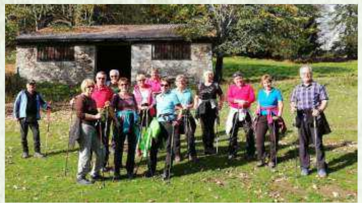
„Kiensteiner Öde“ höchster Punkt der Gemeinde St. Veit