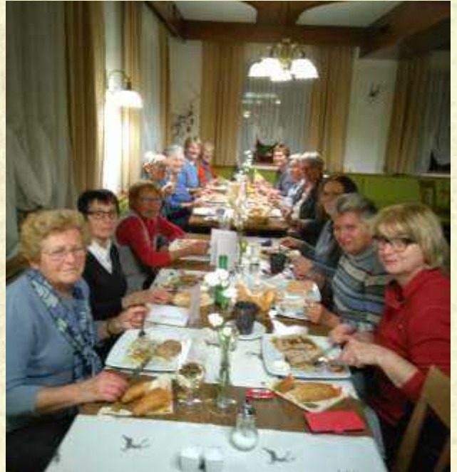
Gemütlicher Abschluss der Laternenwanderung