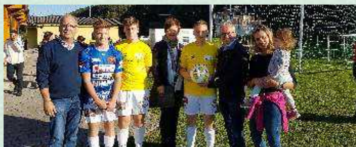
St.Veit – Ratzersdorf 21.09.19 Ergebnis 0:8