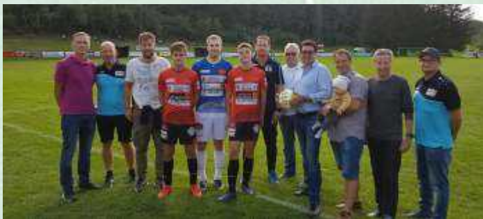
St.Veit - Kapelln 14.09.19 Ergebnis 1:2