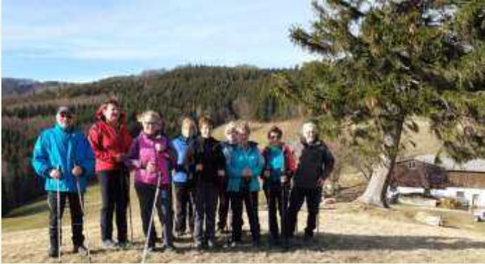
„Anwesen Hinterleitner“ in der Steinwandleiten

Neue Teilnehmer sind herzlich willkommen - ganzjährig, jeden Montag um 14 Uhr, Treffpunkt Kirchenplatz St.Veit