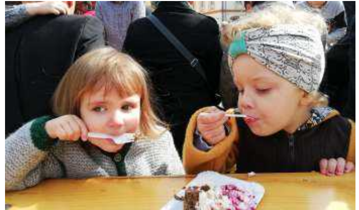
Auch den jüngsten Unionmitgliedern schmeckte es sehr gut!