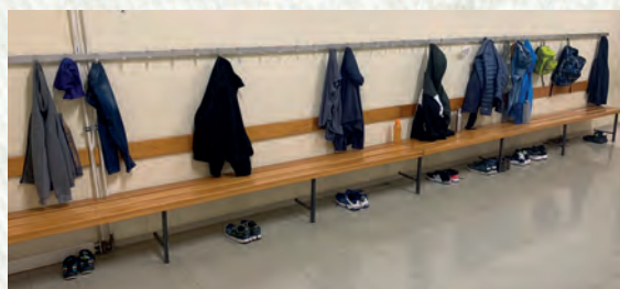
„Wie Innen so im Außen“ Karate schult Körper und Geist