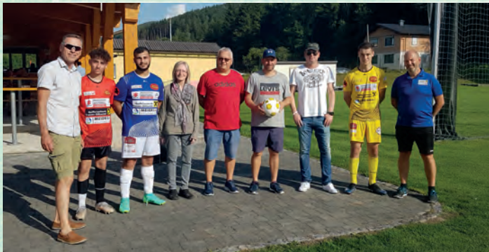
14.08.21 gegen Preßbaum, Ergebnis 1:1 Patronanz, Ballspende, Bier- bzw. Getränkespende und Geschenktasse: SPÖ St. Veit