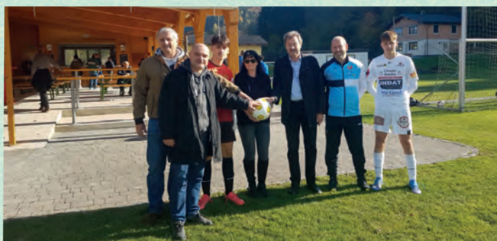
30.10.21 gegen Obergrafendorf, Ergebnis 0:2 Patronanz, Ballspende, Bier- bzw. Getränkespende und Geschenktasse: SPÖ St. Veit