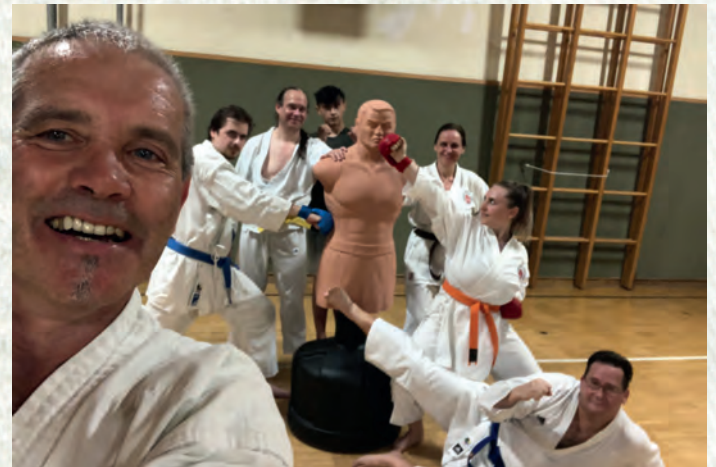
Es macht große Freude mit unserem Dummy zu trainieren