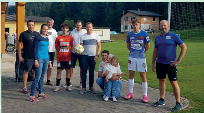
11.09.21 gegen Mank, Ergebnis 3:0 Patronanz, Ballspende, Bier- bzw. Getränkespende und Geschenktasse: ÖVP St. Veit