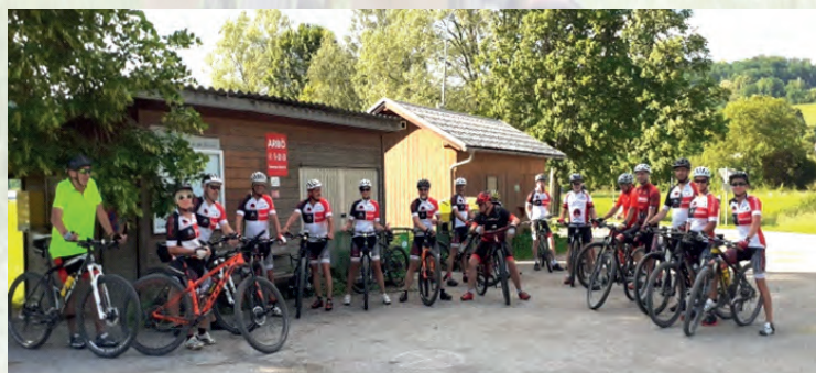
Start zur Donnerstags Ausfahrt