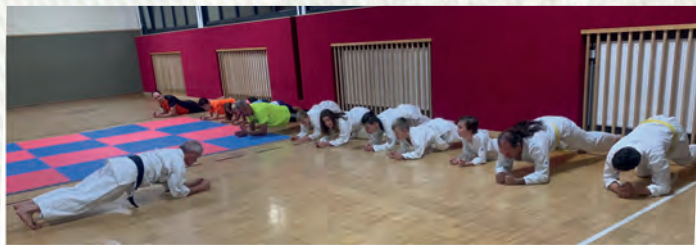
Belohnung nach gelungenen Techniken