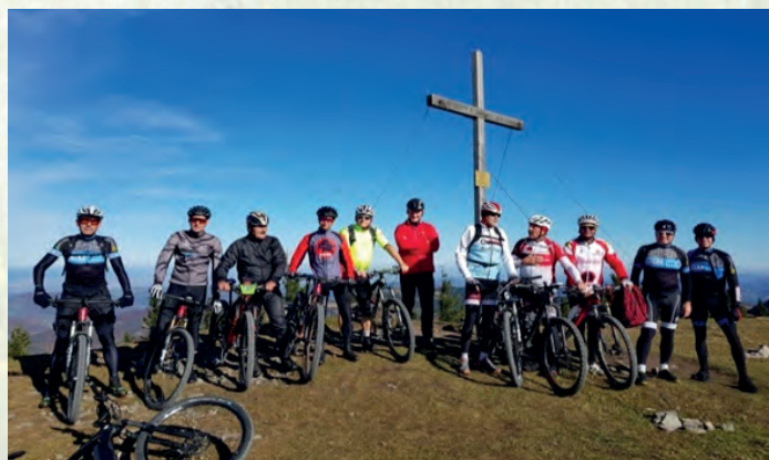
„Gründungsfahrt“ Oktober 2021 auf die Reisalpe