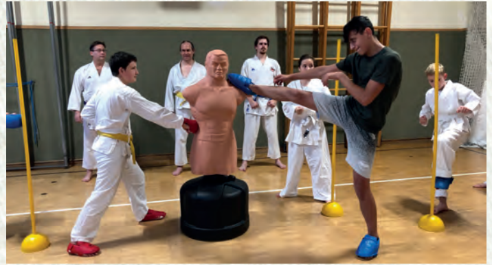
Box-Dummy - Geschenk von RedBull für Nachwuchs-Training