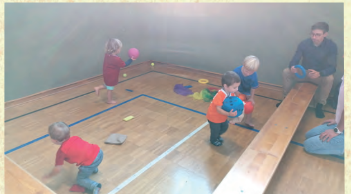
Spielerkiste für die Kleinsten