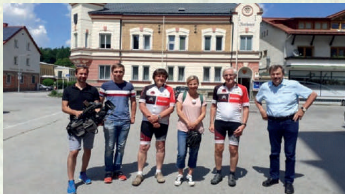
Die Radio NÖ - Sommertour zu Gast in St. Veit