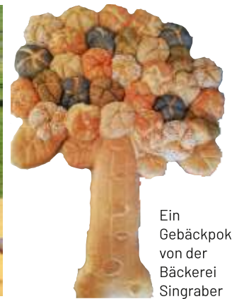
Ein Gebäckpokal von der Bäckerei Singraber