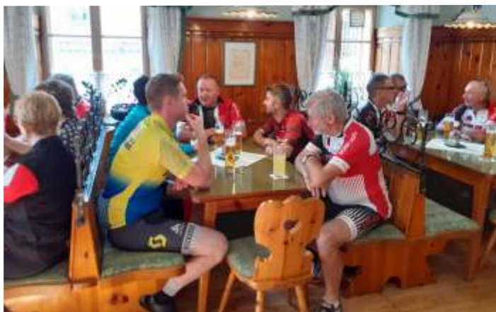
Abschluss Dorfgasthaus Tiefenbacher