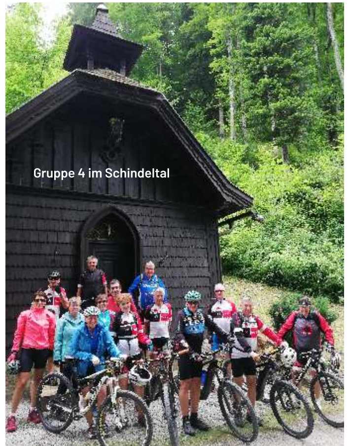
Gruppe 4 im Schindeltal