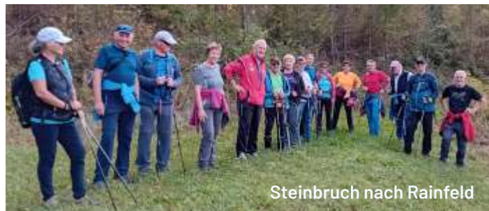
Steinbruch nach Rainfeld