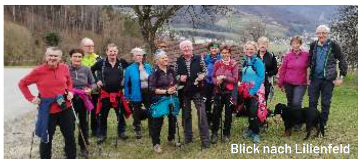
Blick nach Lilienfeld