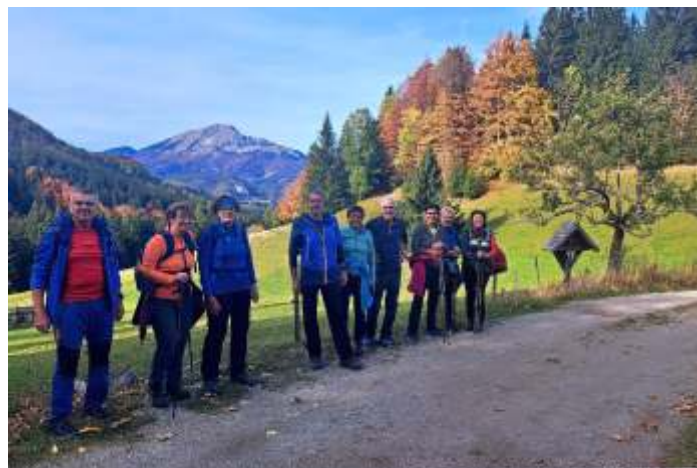
Wanderung von Annaberg nach Mariazell auf unbekanntenen Wegen