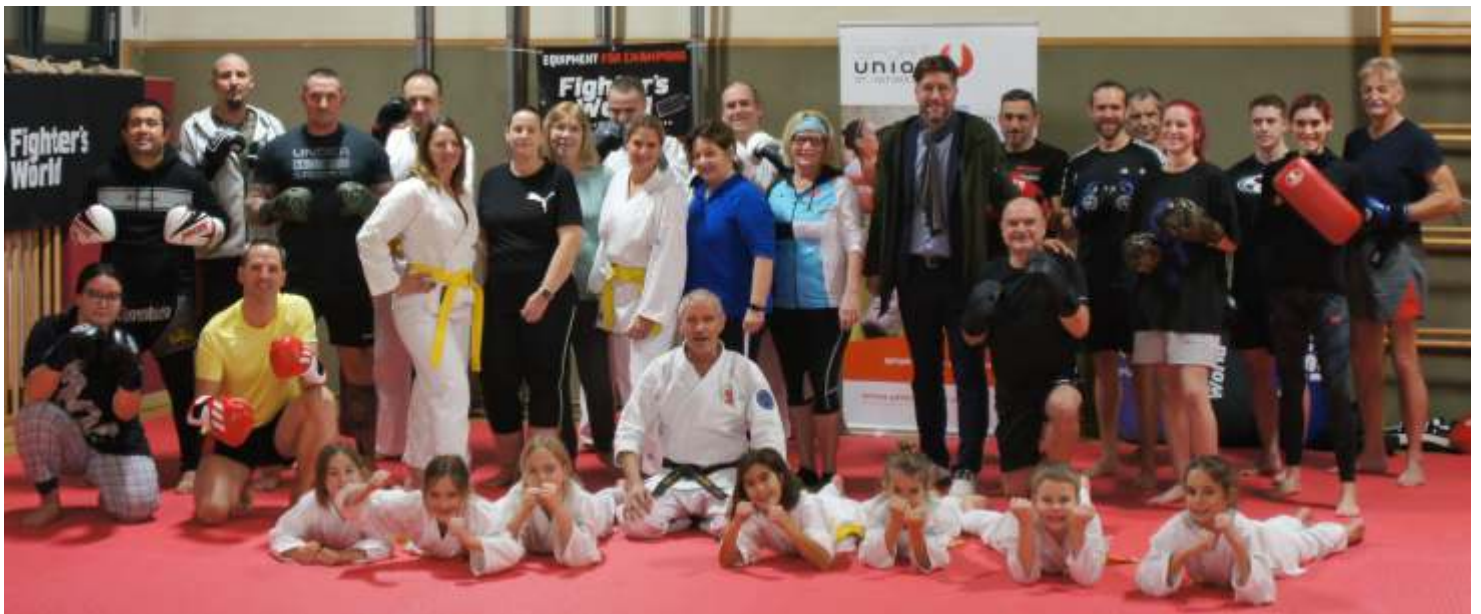
Karateker, Kick-Boxer und Selbstverteidigungs- Kursbesucher füllen jeden Dienstag die Halle der NÖMS St. Veit