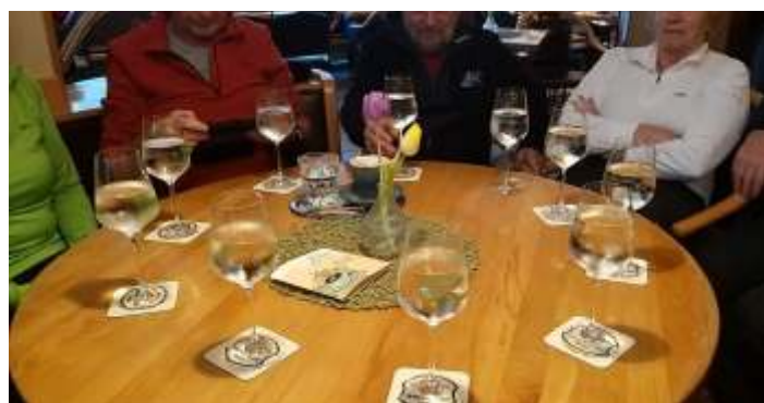
Bei der Nachbesprechung