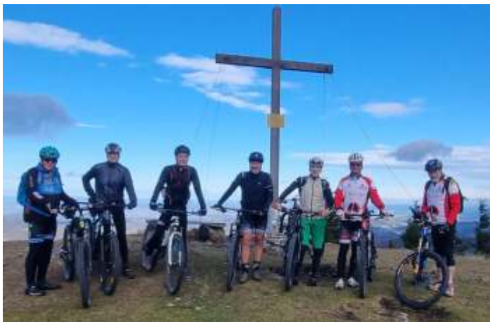
Gründungsfahrt auf die Reissalpe (nur ein Teil der Teilnehmer)