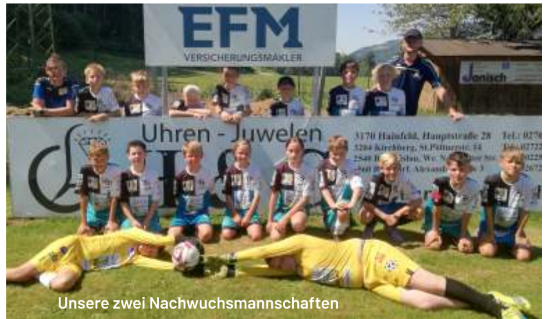
Unsere zwei Nachwuchsmannschaften