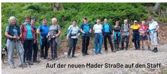
Auf der neuen Mader Straße auf den Staff