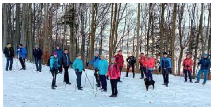
Adventwanderung am 8. Dezember 2023 Richtung „neue Wege auf den Staff“