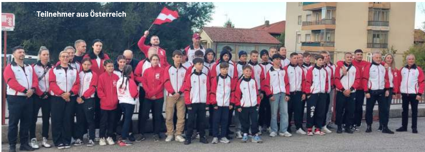
Teilnehmer aus Österreich