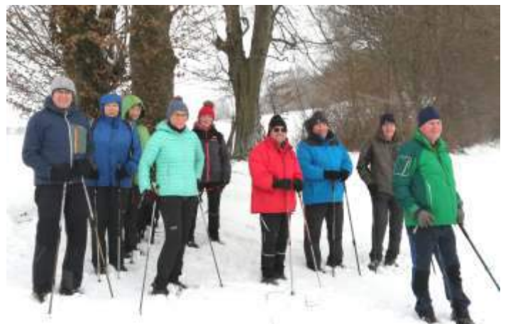
Winterwanderung im Rottenbach