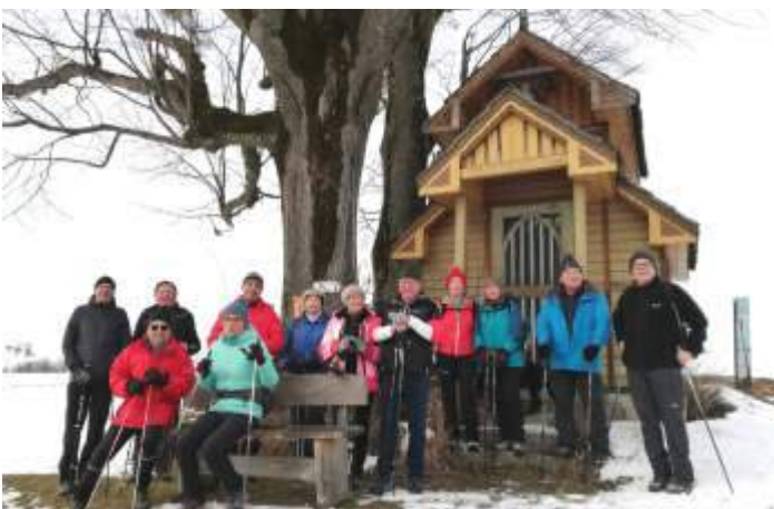
Wiesenbach - Gut Neuhof - Billensteiner