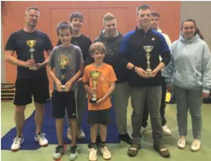
Hobbyturnier Enzesfeld Foto v.l.n.r.: