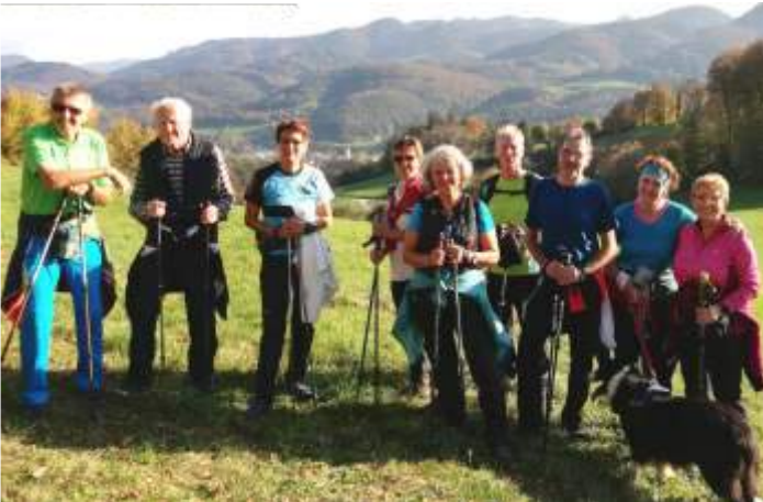
Sonnhof - Bibelweg