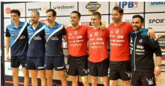
Relegationmatch gg. Mauthausen Foto v.l.n.r.: