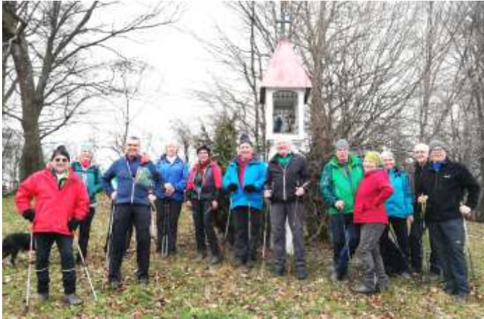
Moreder Kogel mit Blick auf Wiesenfeld

Treffpunkt: ganzjährig, jeden Montag um 14 Uhr, Kirchenplatz St.Veit