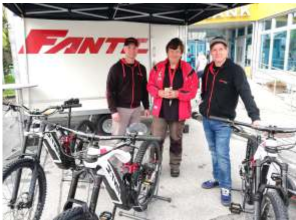
Stand Fa. Enduro