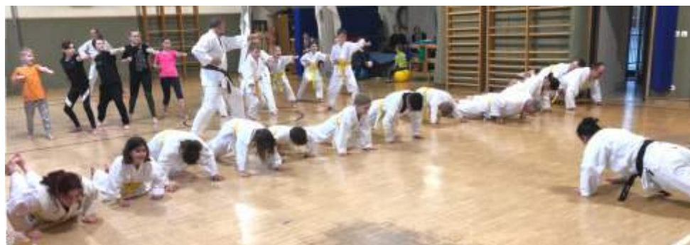
Karatetraining voller Begeisterung und Freude!