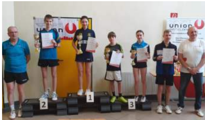
SU Landesmeisterschaft in Mistelbach