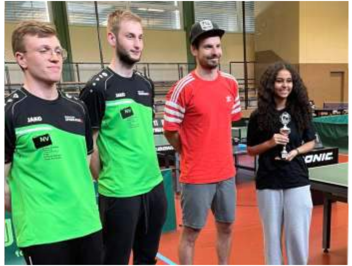
Hobbyturnier Zwettl Foto v.l.n.r.: