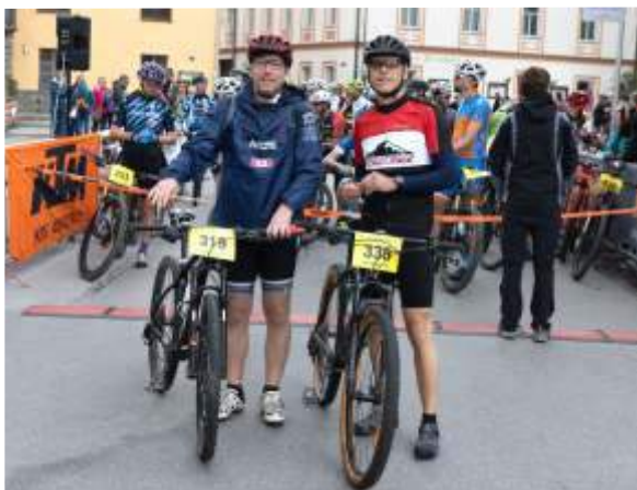
Bürgermeister und Vizebürgermeister am Start