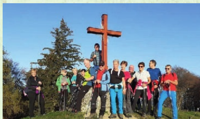
Wanderung auf den Kaiserkogel