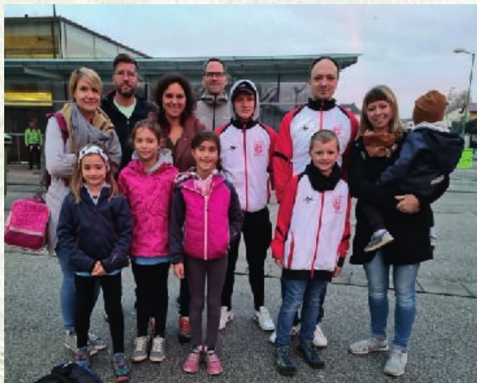
Eltern mit den „Karatekas“