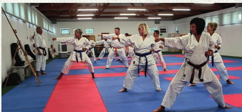
Kumite Training / Wettkampf und KATA-Training mit Erwachsenen!