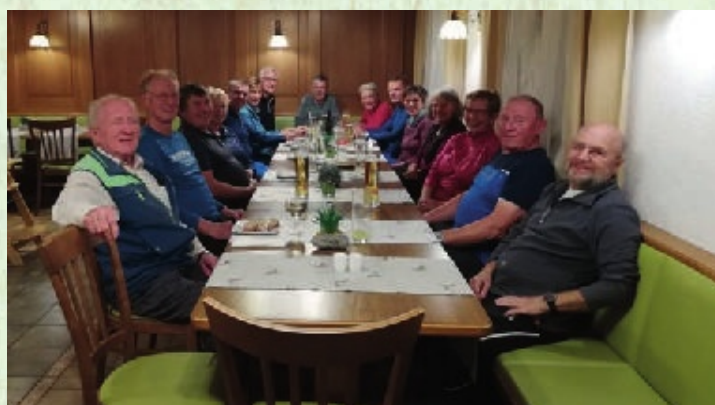
Gemütliches Beisammensein bei einem Wirten im Anschluss an die Wanderung