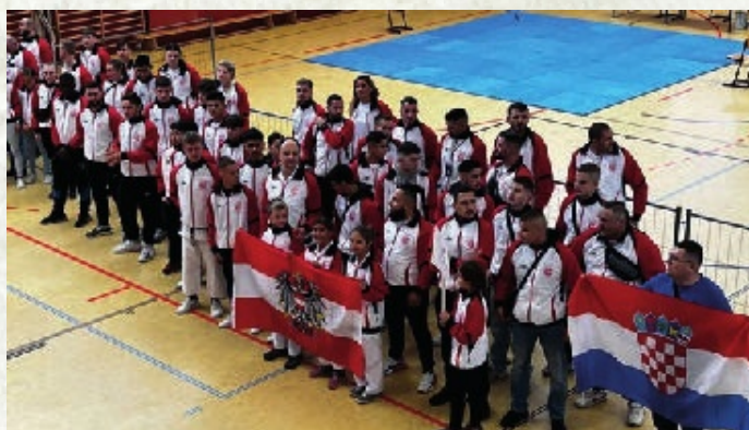
Stolz präsentieren unsere Teilnehmer die Rot-Weiß-Rote Fahne