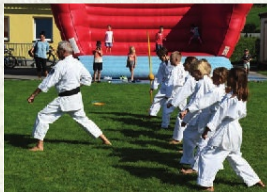
Schautraining beim Ferienspiel Abschlussfest