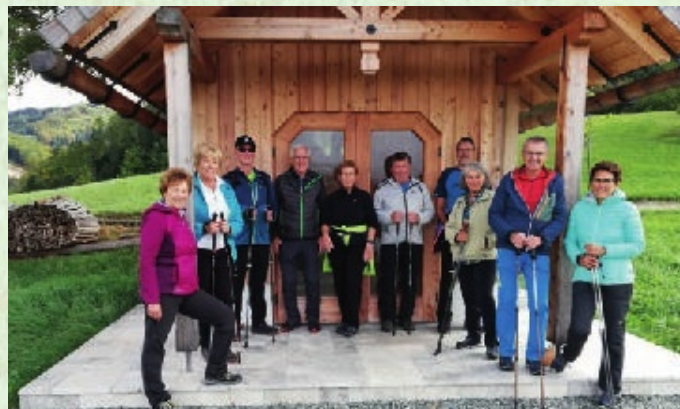
Wanderung zur Heindl Kapelle