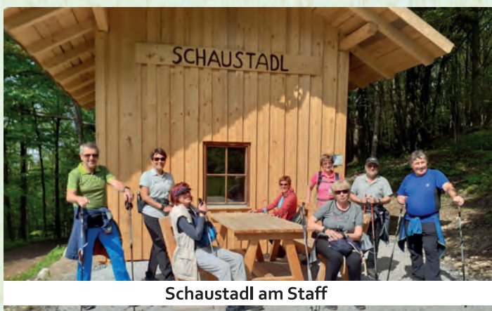
Schaustadl am Staff