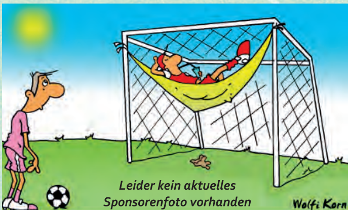
St. Veit gegen Leonhofen 28.5.2022

Patronanz, Ballspende , Getränkespende und Geschenktasse VP St.Veit