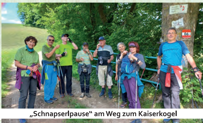
„Schnapserpause“ am Weg zum Kaiserkogel