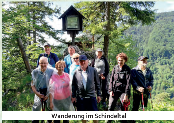
Wanderung im Schindeltal