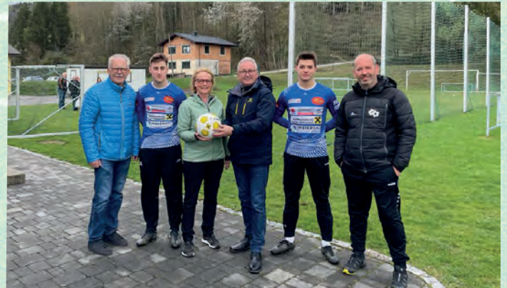
St. Veit gegen Kapelln 16.4.2022