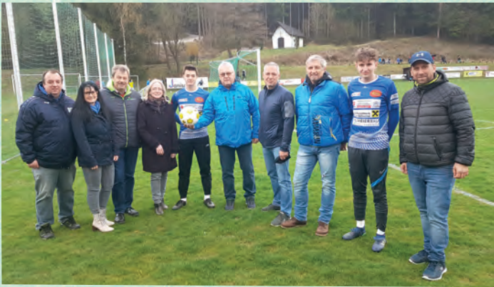
St. Veit gegen Karlstetten 3.4.2022