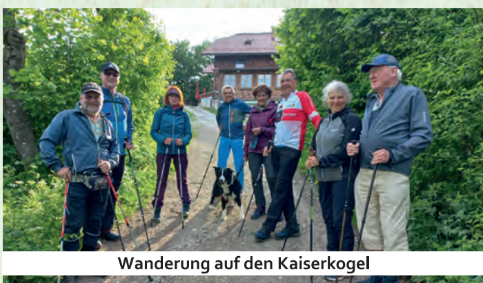
Wanderung auf den Kaiserkogel