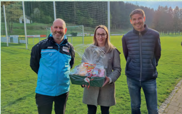
St. Veit gegen Kirchberg 1.5.2022