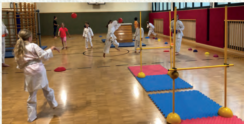
Kleiner Ausschnitt vom Trainingsbetrieb