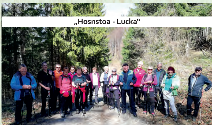
„Hosnstoa - Lucka“