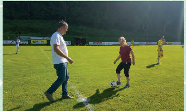
St. Veit gegen Gerersdorf 14.5.2022