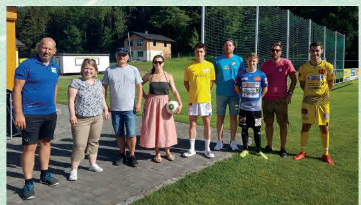
St. Veit gegen Loosdorf 18.6.2022